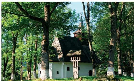
Biserica „Sfântul Ierarh Nicolae”, ctitorie a cnejilor Căndea din Lupșa, 1429