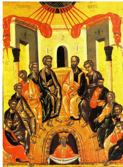
Icoana Pogorării Duhului Sfânt, în stil bizantin

Pentru viața “în Hristos și în Biserică”, formalismul este o plagă care înăbușă lucrarea Duhului, soluția rămânând aceeași dintotdeauna: lepădarea de noi înșine (renunțarea la propriile idei, concepte, sisteme de raționament în favoarea celor deja existente, ale Bisericii), prin acceptarea voinței lui Dumnezeu în viața noastră (în loc de a-L convinge să facă voia noastră) și mai ales prin acceptarea Bisericii ca locaș de mântuire, ca spital duhovnicesc în care oameni păcătoși se mântuiesc prin oameni păcătoși, dar mai ales ca Trup tainic al lui Hristos prin primirea Sfințelor Taine ale Bisericii.