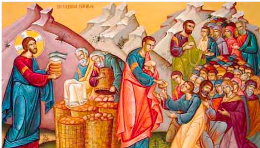
Icoana înmulțirii pâinilor. Hristos primește o jertfă mică și o întoarce înmulțită