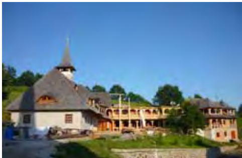
Schitul "Schimbarea la Față", pe când era încă în construcție