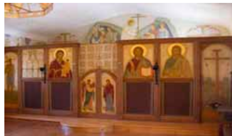
Catapeteasma Bisericii "Mici" a Mănăstirii, construită deasupra mormântului Părintelui Sofronie

Seara am plecat spre Londra, iar doua zi am participat la Sfânta Liturghie în parohia „Sf. Gheorghe” de acolo. Acolo am avut sentimentul că sunt în România; într-atât de mult specific românesc dau oamenii locului aceuia, unde eram toți adunați în rugăciune, unde cinci preoți români slujeau împreună Sfânta Liturghie.