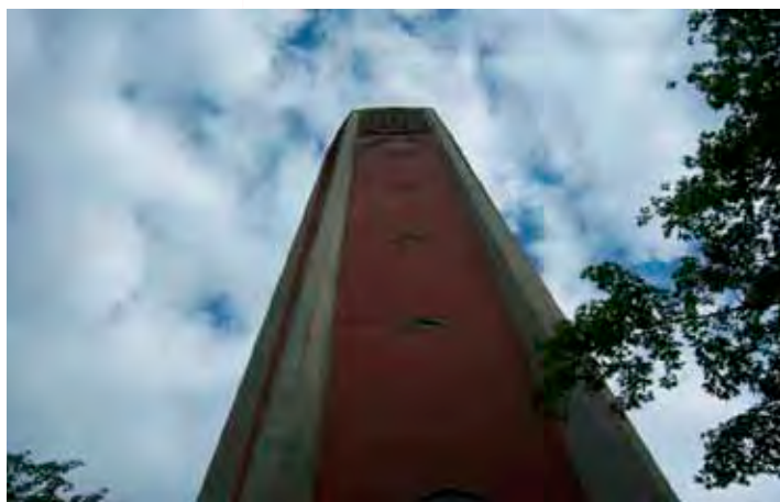
Turnul bisericii Kapernaum are o înălțime de aproximativ patruzeci de metri

În pofida tuturor piedicilor, nădejdea noastră rămâne la bunul Dumnezeu, pe Care nu încetăm a-L ruga să ne arate o cale către „împlinirea gândului nostru”, așa cum frumos spune și Rugăciunea pentru Înălțarea unei Biserici. Rugăciunea puternică a fiecăruia dintre noi, la fel ca și jertfa concretă, sunt necesare acum mai