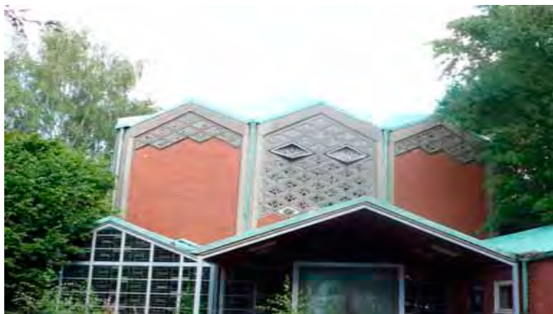
Intrarea în Kapernaumkirche. După cum se vede, clădirea este ca și părăsită și are nevoie de reparații serioase

“Însuși, Doamne, Care ai întemeiat cu negrăită înțelepciune Biserica Ta, ascultă rugăciunea noastră în ceasul acesta și în orice zi Te vom chema; privește cu milos-