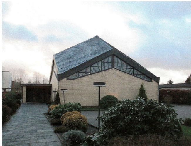
Adresa bisericii este: Tegelweg 151, 22159 Hamburg